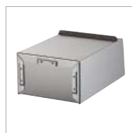
Drei Einstecklaschen am Behälterboden zur alternativen Befestigung des Beutelspenders

Passende Hygienebeutel aus Kunststoff oder Papier sowie passende Abfallbeutel finden Sie in unserem aktuellen Katalog mit den derzeit gültigen Preisen oder auf unserer Homepage www.air-wolf.de