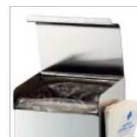
Eingelegter Abfallbeutel bei geschlossener Klappe von außen nicht sichtbar