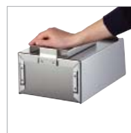
Arretierung des Beutelspenders durch Einrasten und zusätzliche, unsichtbare Verklebung