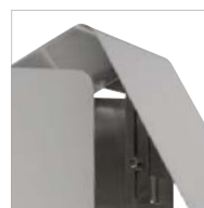
Feststellriegel im Detail