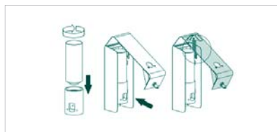
Sprüheinheit separat zur Befüllung entnehmbar

Passende Duftdosen finden Sie in unserem aktuellen Katalog mit den derzeit gültigen Preisen oder auf unserer Homepage www.air-wolf.de